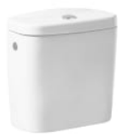
Cisterna de doble descarga 6/3L con alimentación inferior para inodoro