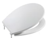
Tapa y asiento para inodoro