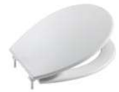
Tapa y asiento para inodoro